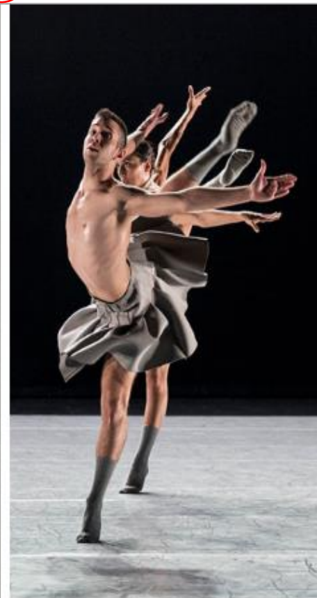
L'Institut del Teatre present al Grec amb IT Dansa, el Premi Adrià Gual i el Premi de Dansa